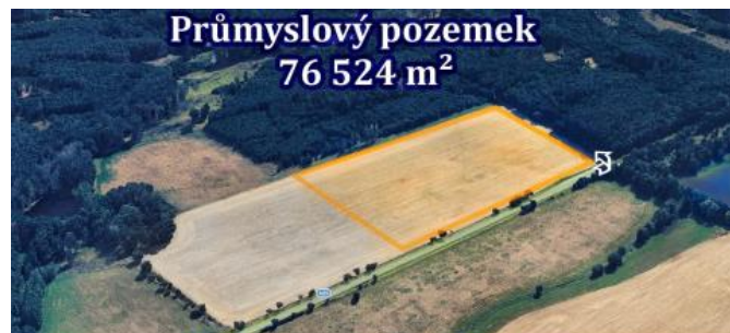
Pňovany u Plzně Poblíž E50 - Rozvadov