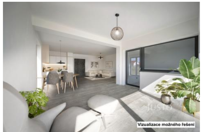
Vizualizace možného řešení

Chodba + schodiště - 9,21 m 2 , ložnice - 19,38 m 2 , koupelna - 6,60 m 2 , pokoj .1 - 16,45 m 2 , pokoj .2 - 13,60 m 2 , celkem 65,24 m 2 + 20,20 m 2 terasa.