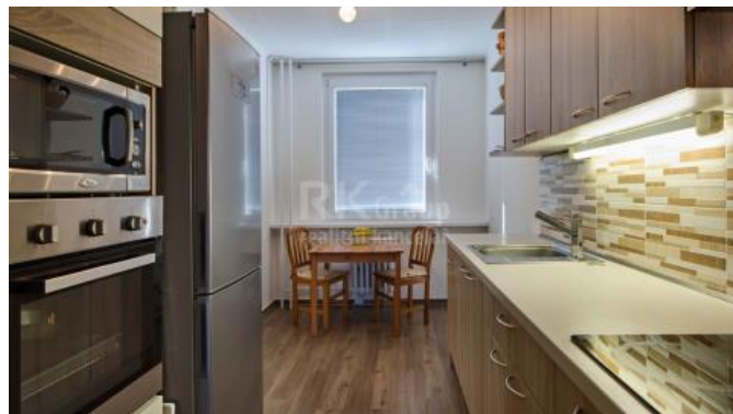
Prodej bytu 3+1, Krynická ulice, Praha 8 - Bohnice 3. patro, 65 m 2 + lodžie 6 m 2 + sklep