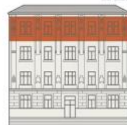
POZICE V RÁMCI PODLAŽÍ