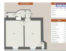
POZICE V RÁMCI PODLAŽÍ